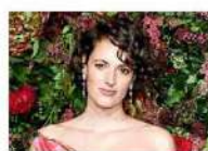
Ausgezeichnete Autorin: Phoebe Waller-Bridge.